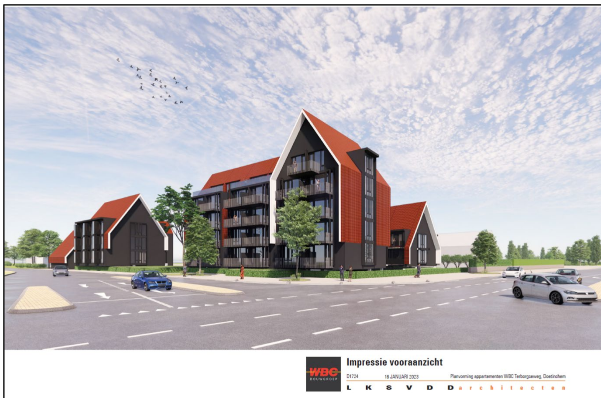
Afbeelding 3 3D-impressie gewenste situatie